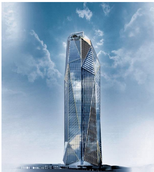
Beeld van Ateliers Jean Nouvel

Uitzicht vanaf de HEKLA-toren: www.hekla360.com